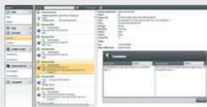
Отображение в виде списка и окно автономного перевода